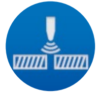
SALDATURA AD ULTRASUONI ULTRASONIC WELDING