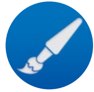
STAMPA: OFFSET, SERIGRAFIA, DIGITALE PRINTING: OFFSET, SILK-SCREEN, DIGITAL