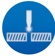
SALDATURA A CALDO HEAT WELDING