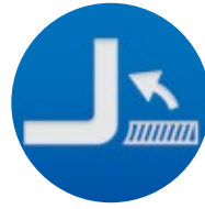
PIEGATURA A FREDDO ED A CALDO HEAT AND COLD BENDING